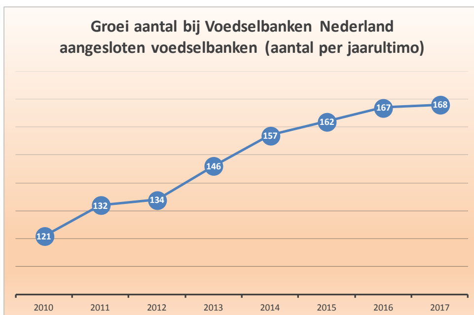
Fig. 1 Ontwikkeling aantal bij Voedselbanken Nederland aangesloten voedselbanken. Peildatum 31.12.